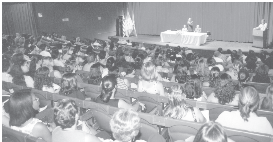
As atividades têm como principal proposta as ações práticas e transformadoras