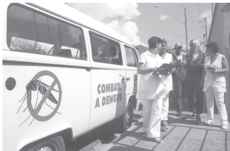
Agentes comunitárias vistoriam residências e orientam a população

Conforme destaca o prefeito Vitor Lippi, "neste trabalho de mobilização devido aos altos índices de concentração das larvas do Aedes aegypti verificados naquela região da cidade, o apoio das equipes do Médico da Família é fundamental para revertermos essa situação preocupante, pois os profissionais que as compõem conhecem muito bem cada um daqueles bairros e seus moradores, fato que facilita as ações