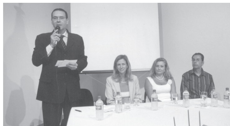
Programa tem como objetivo incentivar o hábito da leitura

Com a presença do prefeito Vitor Lippi; da secretária de Estado da Cultura, Cláudia Costin; e da deputada estadual Maria Lúcia Amary - entre outras autoridades -, Sorocaba sediou nesta semana o 2º Workshop de Bibliotecas Públicas Municipais, reunindo profissionais da área de 76 municípios da região na nova Biblioteca Municipal "Jorge Guilherme Senger".