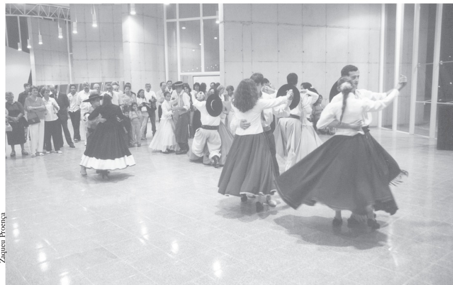
Semana do Tropeiro foi aberta oficialmente na Biblioteca Municipal em 20 de maio

Começa nesta quarta-feira (25/5) a apresentação dos shows musicais programados para a 38ª Semana do Tropeiro de Sorocaba, evento que foi aberto oficialmente em 20 de maio pelo prefeito Vitor Lippi. Os shows vão acontecer no Centro Hípico Pagliato e o ingresso será um quilo de alimento não perecível. Todo alimento arrecadado será revertido em favor do Fundo Social de Solidariedade do Município. No domingo (29) acontece o tradicional Desfile de Cavaleiros por algumas das principais ruas e avenidas da cidade. A Semana do Tropeiro é uma promoção da Prefeitura de Sorocaba, através da Secretaria Municipal da Cultura.