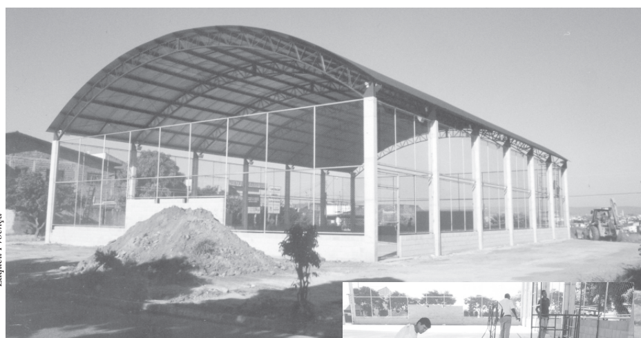
A Prefeitura concluiu a construção da quadra...

A Prefeitura está concluindo os detalhes de construção de uma quadra poliesportiva coberta no Jardim Guaíba, na zona norte da cidade. A obra interna já se encontra concluída e os trabalhos agora se concentram na parte externa. A Secretaria de Obras e Infraestrutura Urbana realiza internamente ainda apenas a soldagem dos alambrados que cercam todo o espaço. Na parte interna também está sendo feita a pintura das faixas coloridas de demarcação para a disputa dos jogos. Até o final da semana serão ligadas e testadas as luminárias de mercúrio que foram instaladas nesta semana. Ao mesmo tempo em que terminam a parte interna, os funcionários da Secretaria de Obras vão executar a implantação de calçadas no entorno da construção e farão o plantio de grama nos dois terrenos existentes de cada lado do prédio.