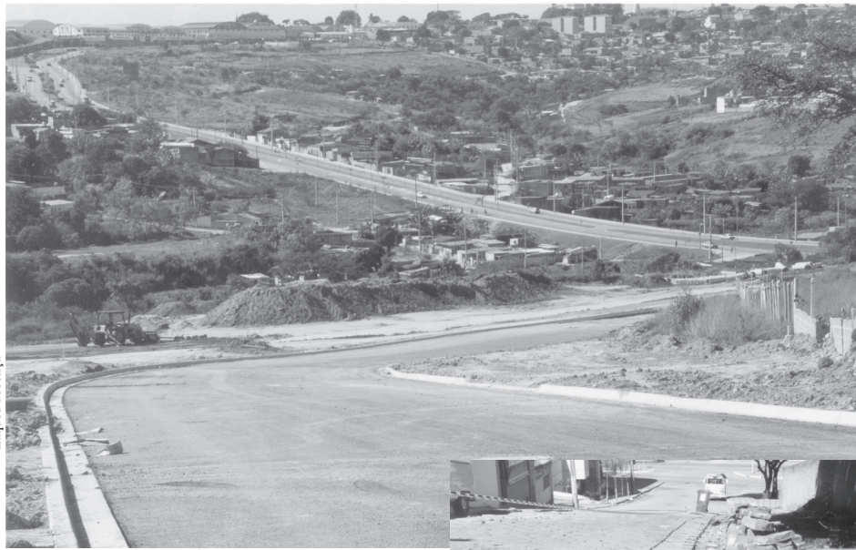
Nova avenida interliga a General Osório ao Wanel Ville

Também nesta semana, a Prefeitura iniciou a pavimentação da rua Naim, a primeira das quatro no Jardim Betânia que serão pavimentadas. A rua serve de acesso ao Lar São Vicente de Paulo, que abriga 108 idosos com idades entre 60 e 99 anos, e registra grande movimento, pois liga o bairro ao Jardim