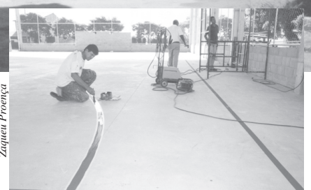
... e iniciou a urbanização da parte externa da nova área de lazer da cidade

Barros Nardy, altura do número 120. Os recursos para a construção dessa quadra vieram de uma parceria com o Ministério dos Esportes, por meio do Programa Esporte Solidário. O programa destina-se a melhorar a qualidade de vida das comunidades mais carentes com o esporte.