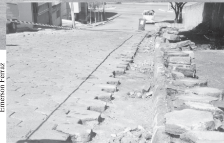
Pavimento de ladrilhos da Rua Fagundes será substituído por asfalto

A obra de interligação das avenidas é a primeira a ser construída por meio de parceria no governo do prefeito Vítor Lippi. O prefeito definiu com os proprietários lindeiros a serem beneficiados que eles banquem pelo menos 40% do custo total. Serão 480 metros lineares no sentido bairro/centro, partindo da Paulo Emanuel