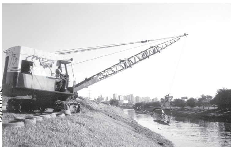
Dragas trabalham atualmente no Jardim Maria do Carmo e nas imediações da Usina Cultural Municipal

Rio assoreado é sinônimo de transbordamentos nos períodos de chuvas mais intensas. Determinada a poupar transtornos à população, a Administração Municipal incluiu em seu cronograma de obras permanentes o desassoreamento do Rio Sorocaba e de seus principais afluentes. O Serviço Autônomo de Água e Esgoto (Saae) dá prosseguimento ao trabalho com duas dragas trabalhando e equipamentos de apoio, como pás-carregadeiras e caminhões para o transporte do material retirado. Atualmente, os serviços estão sendo executados nas proximidades da avenida Artur Bernardes, no Jardim Maria do Carmo, e nas imediações da Usina Cultural Municipal.