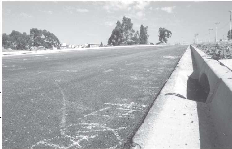
A base para asfaltamento, guias, sarjetas e rede de águas pluviais estão sendo concluídas

A outra pista, no sentido centro-bairro, exigirá a preparação de apenas 480 metros lineares. Isto ocorre devido à proximidade da área com o bairro Wanel Ville 2. A via foi quase totalmente pavimentada pela empresa que comercializou os