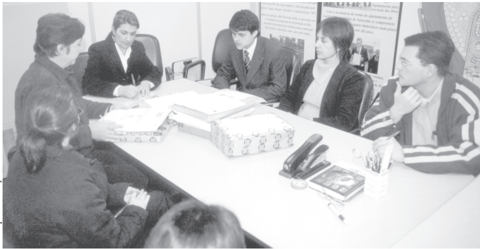
Saae fez cinco sessões na terça e quarta-feira para abrir envelopes com documentação das empresas e receber as propostas

Saae reiniciou as licitações das cinco obras que complementam o sistema de tratamento de esgotos