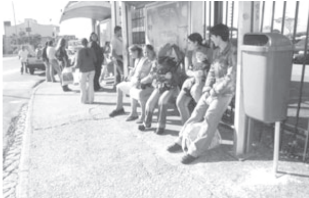
Lixeiras foram implantadas nos locais de maior concentração de pessoas

A Secretaria de Obras e Infra-estrutura Urbana da Prefeitura de Sorocaba instalou 40 lixeiras na Avenida Antônio Carlos Cômitre, o principal corredor de comércio do bairro Campolim, na zona sul da cidade. As lixeiras têm capacidade para 50 litros de lixo, quantidade que corresponde ao que produz o movimento de pedestres em uma via como aquela. A intenção é que os freqüentadores dêem preferência para depositar o lixo reciclável nesses locais.