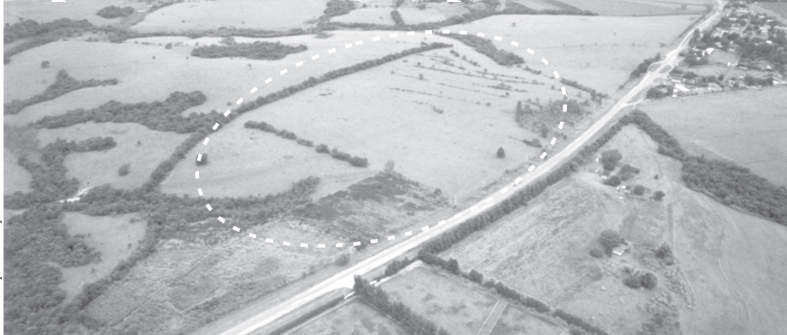
O terreno de 700 mil metros quadrados, demarcado na foto, fica no quilômetro 110 da Rodovia João Leme dos Santos