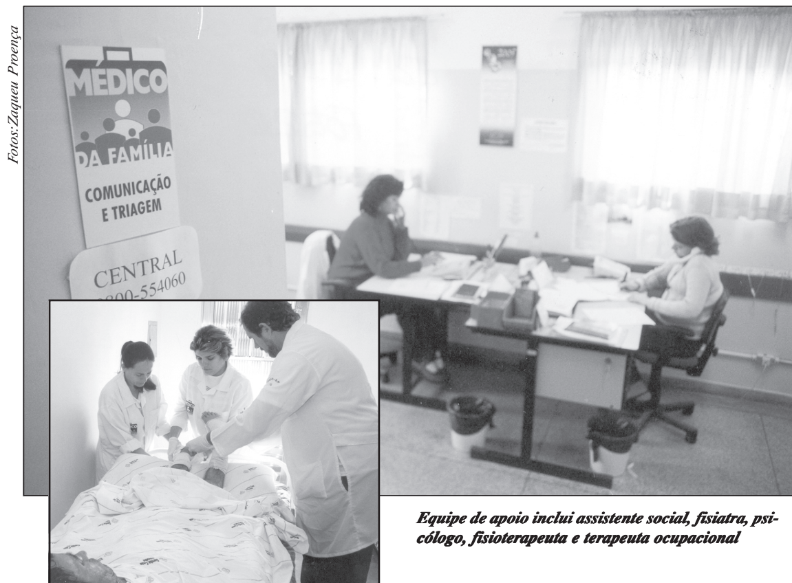
Equipe de apoio inclui assistente social, fisiatra, psicólogo, fisioterapeuta e terapeuta ocupacional

O novo projeto inclui palestras, aulas em campo, experiências e brincadeiras voltadas à preservação do meio ambiente, manuseio de animais e excursões ecológicas. Todas as atividades darão ênfase ao reaproveitamento de materiais e reciclagens. As atividades serão orientadas por monitores contratados pela Prefeitura e treinados na Universidade de São Paulo (USP).