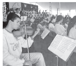
Projeto Guri ensina música a crianças pobres

CINEMA Cine Clube Municipal - Fundec - 20 horas "A Trapaça" (EUA 1997/ drama). Censura 14 anos.