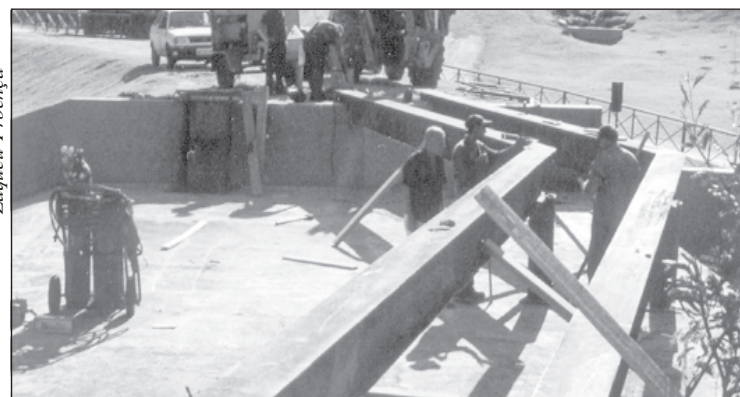
Funcionários do Saae concluíram a estrutura da ponte