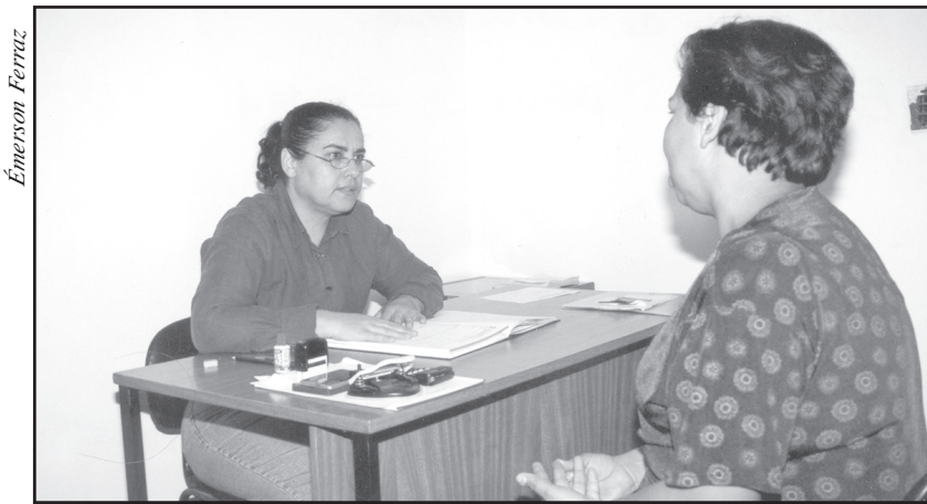
Promoção Social atende famílias de baixa renda, deficientes físicos e idosos

Nestes casos, os atendimentos são precedidos de criterioso levantamento sócio-econômico realizado