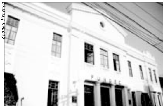
Fundec sedia exposições, apresentações musicais e teatrais e o Cine Clube Municipal

• Até 22/10 (8 às 18 h) Local: Largo do Rosário Barracas de artesanato e comidas típicas.