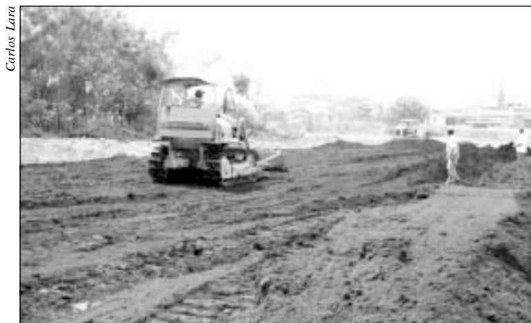
Construção do dique de proteção teve início no dia 14 de outubro

O planejamento do Saae prevê para os próximos dias o início de uma nova frente de trabalho,