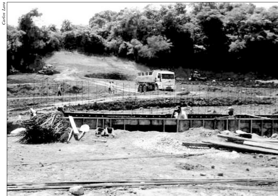
A represa garante a operação integral da ETA do Éden nos períodos de estiagem

Além disso, toda a área de alagamento está sendo limpa, o que proporcionará um pequeno aprofundamento da represa.