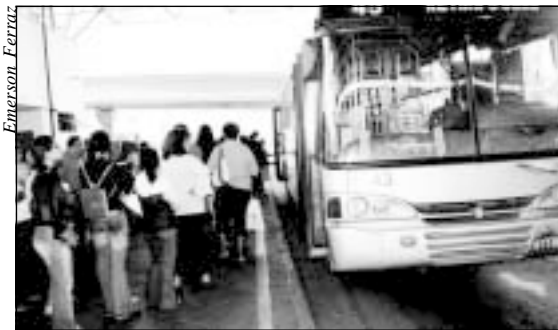
Sistema de transporte coletivo municipal opera 88 linhas

As primeiras linhas de ônibus começam a operar a partir das 4 horas, saindo dos pontos finais. Entre