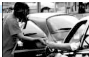
Criança é o principal alvo