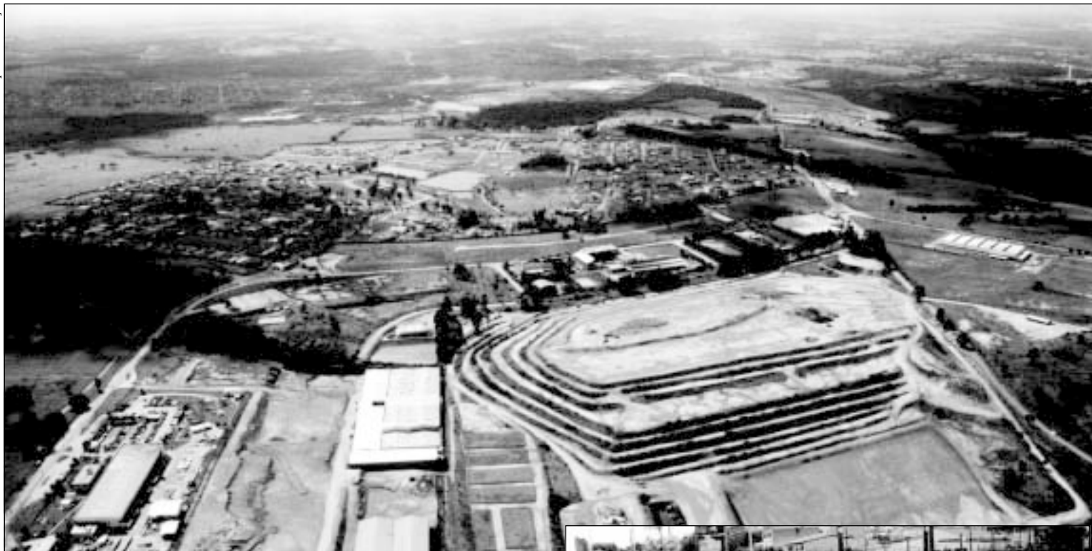
O aterro sanitário utilizado atualmente, no Retiro São João, tem apenas mais dois anos de vida útil. Sistema de contêineres (ao lado) será ampliado para 99% das ruas sorocabanas

O processo estava paralisado havia quase dois meses, desde que o Ibama deu parecer contrário à instalação naquela área, após ser questionado sobre isso pelo proprietário do imóvel.