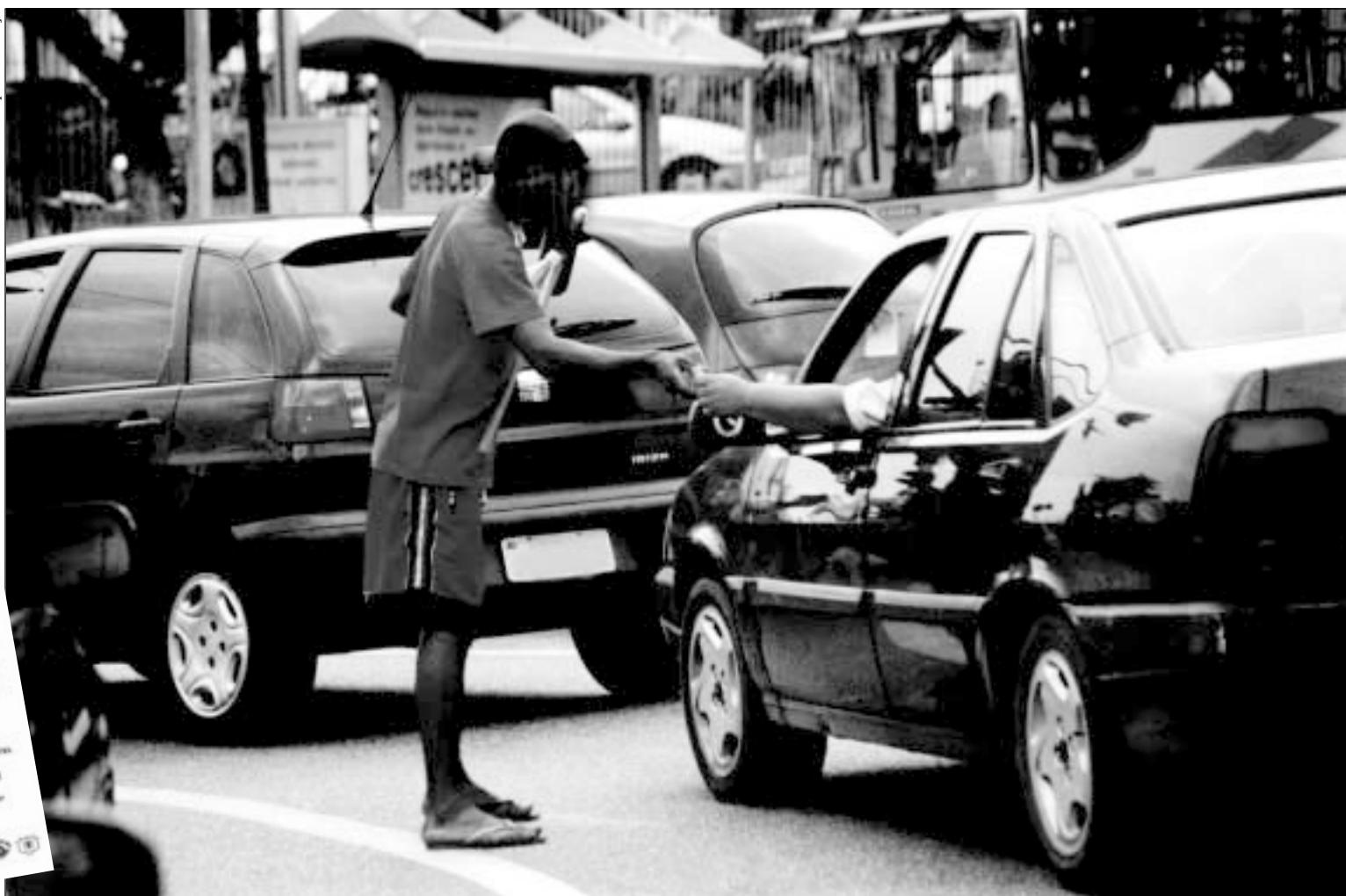
Objetivo da Prefeitura e seus parceiros é recuperar a cidadania das pessoas, principalmente crianças, que precisam pedir esmola para sobreviver