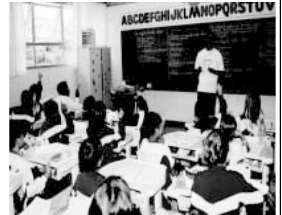
As 117 escolas municipais atendem a 45 mil alunos dos Ensinos Infantil, Fundamental e Médio