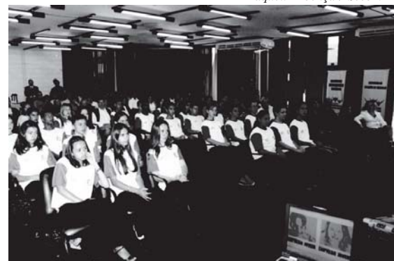
A primeira turma do programa, composta por estudantes do Ensino Médio, está no Paço desde dezembro de 2005

Eles serão analisados nos primeiros seis meses e conforme a sua avaliação, poderão ter o seu estágio renovado por mais seis meses.