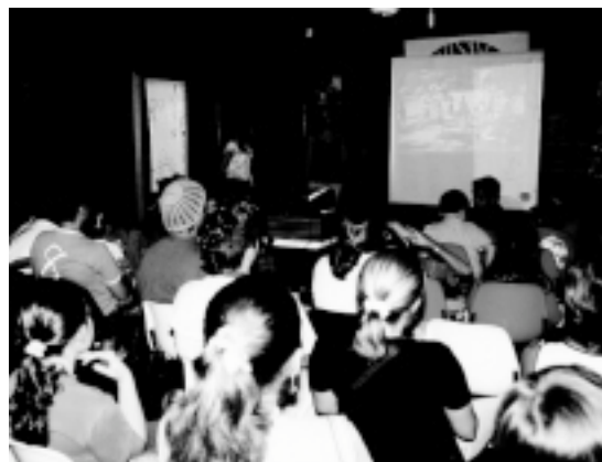
O projeto visa conscientizar crianças e adolescentes sobre a importância da preservação ambiental