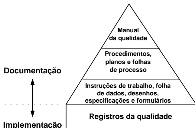
Figura 2 – Estrutura da documentação do SGQ

Nível 1 - O Manual da Qualidade descreve o sistema de gestão da qualidade de forma abrangente e resumida, incluindo: