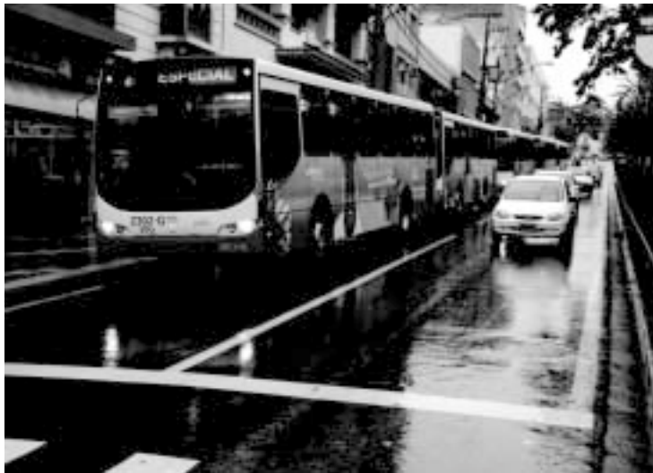
A utilização dos veículos faz parte de projeto experimental, em parceria com o Governo do Estado, com a duração de três meses

Já os ônibus da empresa Sistema de Transporte Urbano (STU), serão utilizados nas linhas 65 – Campolim, 17 – Central Parque e 32 – Vila Haro. Na sexta-feira, dia 31/03, os ônibus estarão nas linhas da TCS: 55 – Jardim Rodrigo, 19 – Vila Progresso e 14 – Santa Rosália e da STU: 30 – Brigadeiro Tobias, 48 – Aparecidinha/Castelinho e 06/47 – Barcelona/Vila Hortência. No sábado (1º de abril), os ônibus movidos a GNV estarão nas linhas da TCS: 42 – Parque das Laranjeiras, 53 – Éden e 46 – Paineiras e da STU: 65 – Campolim, 60 – Ouro Fino e 73 – Júlio de Mesquita.