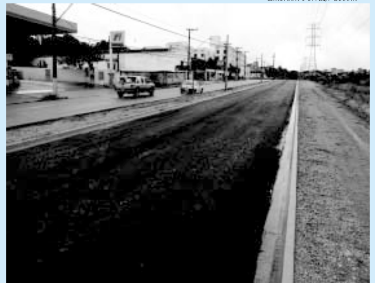
Emerson Ferraz / Secom

DUPLICAÇÃO – A Secretaria de Obras e Infra-Estrutura Urbana da Prefeitura de Sorocaba (Seobe), concluiu esta semana o primeiro trecho das obras de duplicação da avenida Bento Mascarenhas Jequitinhonha. Cerca de 300 metros da pista receberam a pintura impermeabilizante, fase que antecedeu a aplicação da massa asfáltica, realizada no início desta semana.