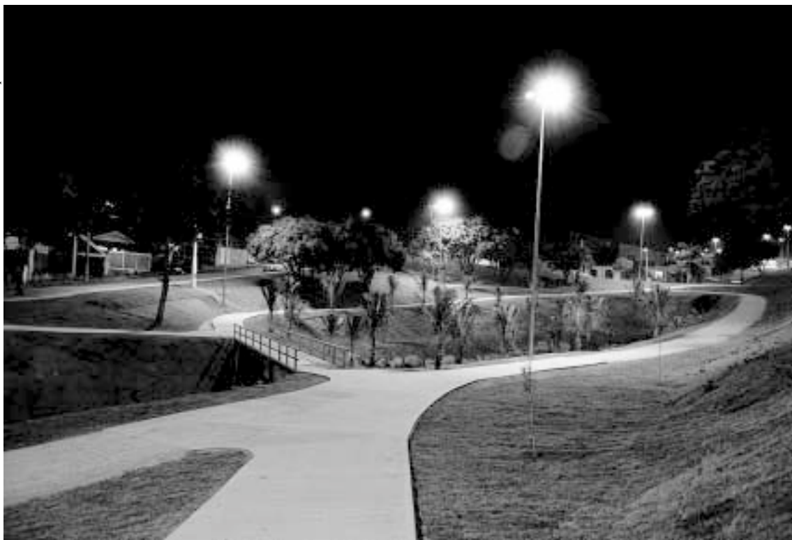
Teste da 'Lombo Faixa'

O Parque João Pellegrini é separado do Centro Esportivo do bairro apenas pela rua Santos de Oliveira. Para integrá-lo ao complexo esportivo e equacionar o problema criado pela existência da via, está sendo testado um novo sistema de redutor de velocidade, chamado "lombo faixa". O conceito, testado pela primeira vez em Sorocaba, é um híbrido de lombada com faixa de pedestre.