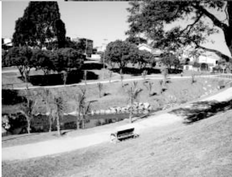
Oito Pistas de Caminhada

A "lombo faixa" é uma lombada mais larga do que um redutor de velocidade normal, sobre a qual é pintada a faixa de segurança por onde os pedestres deverão fazer a travessia para ir do parque ao Centro Esportivo ou vice-versa. A sinalização do solo é feita nas cores vermelha e branca.