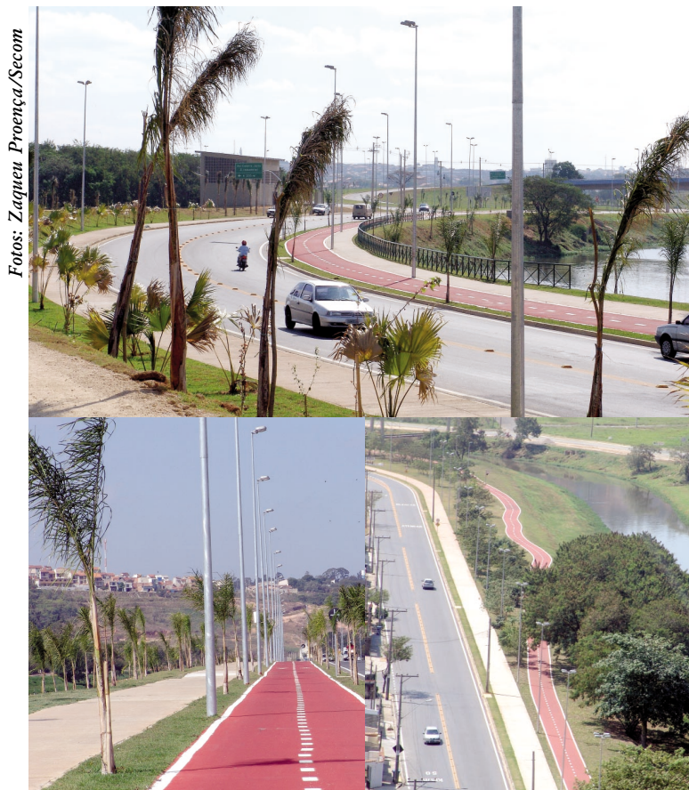
Foram quase 3 km de pista revitalizados e 2.820 metros de ciclovia implantados.

A ciclovia da Dom Aguirre faz parte do projeto da Prefeitura de dotar a cidade de aproximadamente 30 quilômetros de pista até o final de