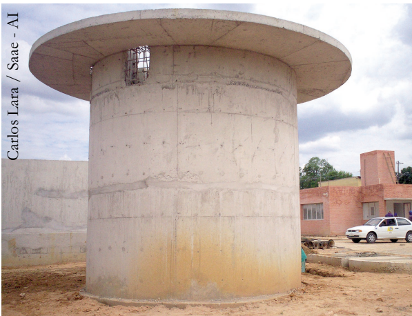
Carlos Lara / Saac - AI

Essa etapa final do Programa de Despoluição do Rio Sorocaba prevê a construção de mais seis ETEs, sendo duas delas para o tratamento de esgoto de dois bairros específicos: Ipaneminha e Quintais do Imperador. As demais quatro estações farão