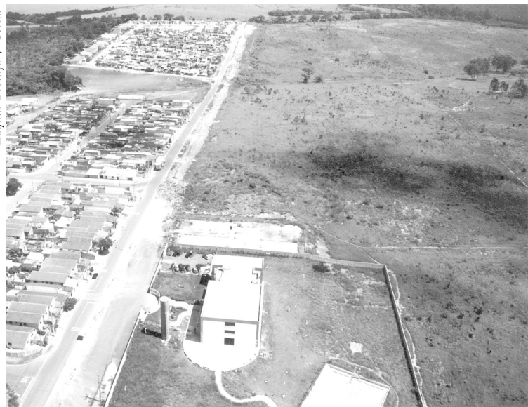
Zaqueu Proença / Secom

Do investimento de mais de R$ 9 milhões, a CEF se responsabilizará por 88%, e a Prefeitura pelos 12% restantes. Os beneficiados pelo pro-