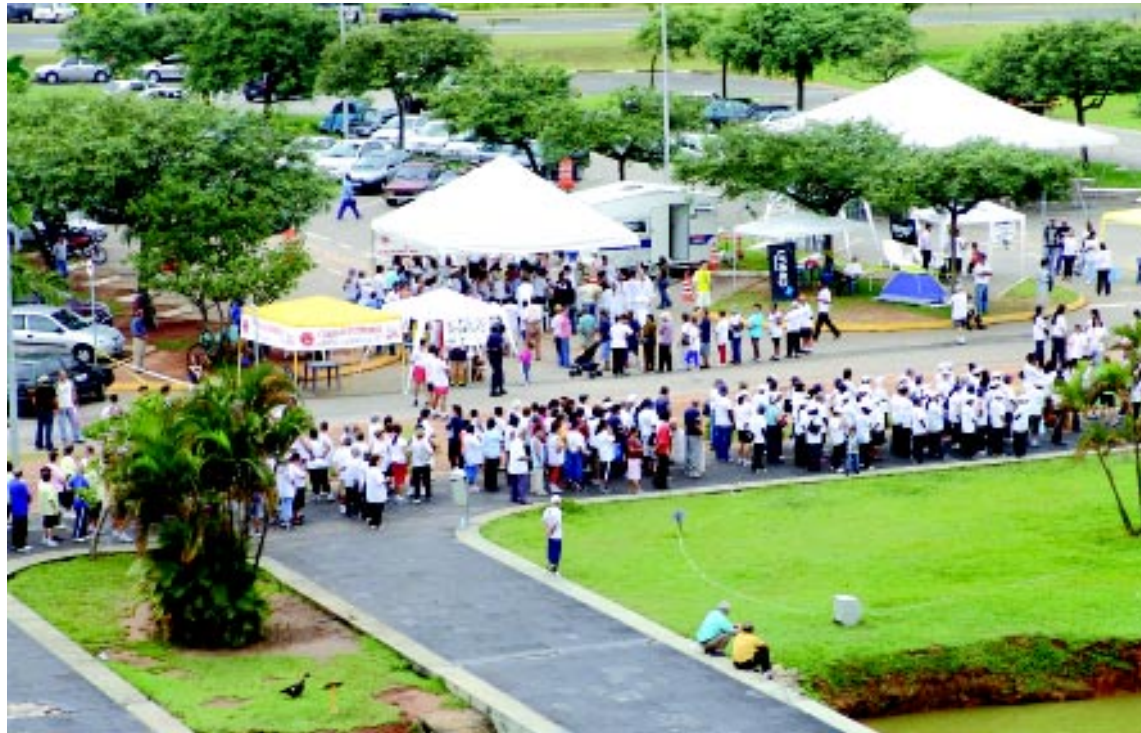
Emerson Ferraz / Secom

Os grupos são formados em indústrias, escolas, universidades, sindicatos, associações, órgãos públicos e por amigos que podem escolher entre duas modalidades de participação, conforme infor-