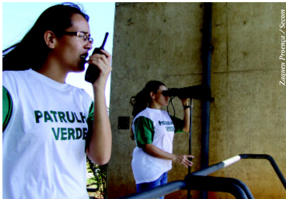
Zaqueu Proença / Secom

A campanha foi antecipada em dois meses em relação ao ano passado. Em 2006, entre julho e novembro, a campanha identificou 871 ocorrências – um aumento de 410% em relação ao mesmo período de 2005. Os integrantes do projeto em 2007 tiveram aulas práticas e teóricas em 3 e 4 de maio e, desde o dia 7, participam de um treinamento nos