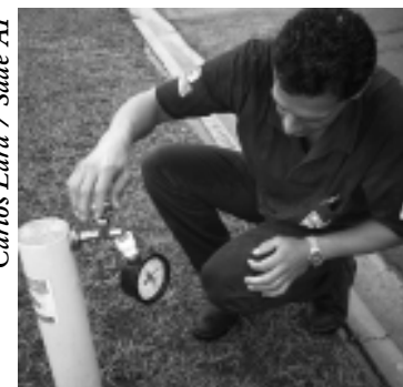
Carlos Lara / Saae AI

De acordo com as diretrizes estabelecidas, cerca de trinta cavaletes de cada região visitada têm a pressão medida e dessa forma, o Saae solicita a colaboração dos munícipes nos casos em que o