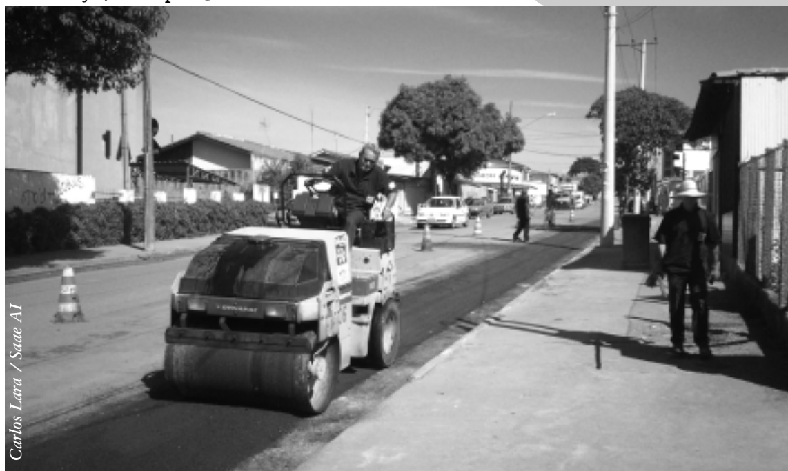
Carlos Lara / Saae AI

COMBATE ÀS QUEIMADAS - A Prefeitura de Sorocaba lançou, na última sexta-feira (18), a segunda edição da campanha de combate às queimadas "Patrulha Verde". O projeto auxilia o Corpo de Bombeiros nos meses de clima mais seco do ano, e conta com a colaboração da população na prevenção e denúncia de ocorrências, consideradas crime ambiental. A Prefeitura montou dois postos de observação, no 5º andar do Paço Municipal e num edifício da avenida Santos Dumont. A "Patrulha Verde" permite ao Corpo de Bombeiros se dirigir apenas aos casos de maior gravidade.