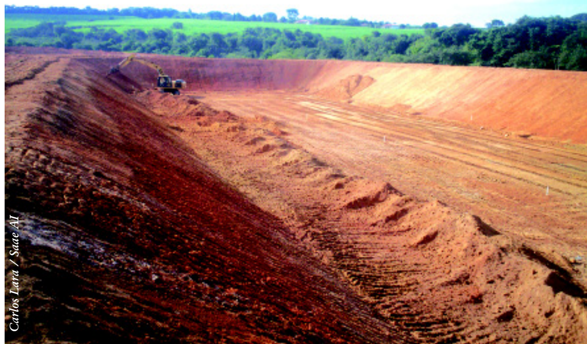
Carlos Lata / Saae AI

A Prefeitura de Sorocaba ainda constrói novas ciclovias nas avenidas 15 de Agosto (2.500 metros), General Osório (400 metros), Antônio Silva Saladino (700 metros), Itavuvu (1.200 metros) e uma interligação entre a Bento Mascarenhas Jequitinhonha e Washington Luiz (1.000 metros). Até o momento, foram inaugurados 8.495 metros, nas avenidas Washington Luiz (400 metros), Bento Jequitinhonha (800 metros), Paulo Emanuel de Almeida (2.300 metros), Camilo Júlio (1.200 metros), Dom Aguirre (2.820 metros) e Elias Maluf (975 metros).