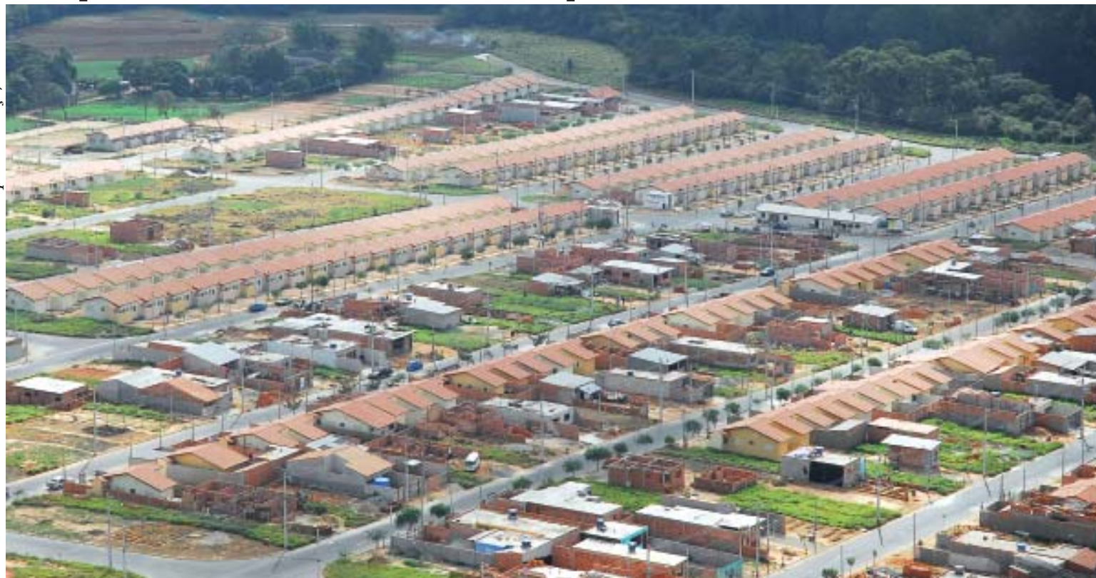
Zaqueu Proença/ Secom

As famílias contempladas pagarão uma prestação mensal de R$ 252,00 para morar em casas com 45,01 m 2 de área privativa, composta por dois quartos, sala, cozinha e banheiro. O prazo do contrato de arrendamento é de 15 anos, com opção de compra ao final desse período. As famílias beneficiadas fizeram o seu cadastro na pesquisa da demanda habitacional realizada pela Secretaria de Habitação, Urbanismo e Meio