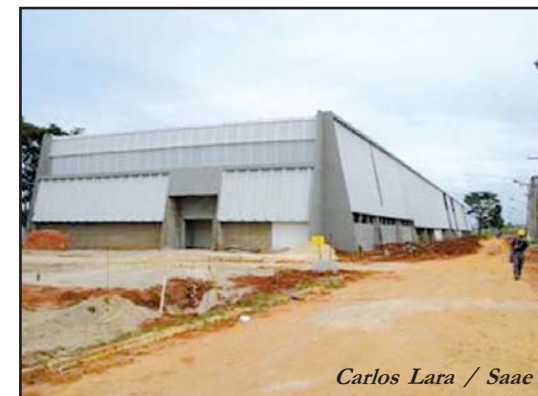
Carlos Lara / Saae

Além disso, está pronta a parte de alvenaria do galpão principal; os vestiários estão em fase de acabamento; as baias para o depósito dos diversos materiais utilizados estão sendo finalizadas; o prédio frontal da administração está na etapa de acabamento e pintura; o refeitório está com a alvenaria sendo finalizada e as redes de água,