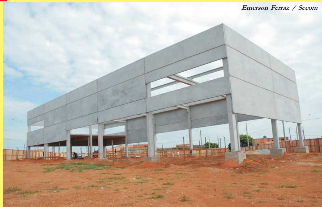
Emerson Ferraz / Secom

SEDE NOVA - As obras para construção da sede do programa "Oficina do Saber", no Conjunto Habitacional "Ana Paula Eleutério", na Zona Norte, continuam em desenvolvimento. Após concluir a estrutura física do prédio em concreto pré-moldado, a Prefeitura de Sorocaba, por meio da Secretaria de Obras e Infra-Estrutura Urbana (Seobe), executa as fundações para implantar as dependências internas do prédio, que abrigará as atividades atualmente realizadas na EM "Prof. Walter Carretero". O Oficina do Saber é um programa da Secretaria da Educação (Sedu), que atende estudantes das 3as e 4as séries do Ensino Fundamental em horários diferentes da escola, com oficinas de arte, aulas de informática, esporte, língua estrangeira, entre outros.