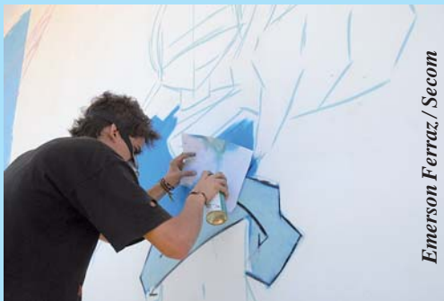
Emerson Ferraz / Secom

Os artistas interessados em fazer parte da seletiva devem apresentar para a Secretaria da Juventude (Sejuv) um pré-projeto colorido do trabalho que pretendem realizar nas pistas. Os grafiteiros escolhidos vão colorir as laterais e a parte de trás das arquibancadas, bem como as laterais das pistas (rampa e bank).