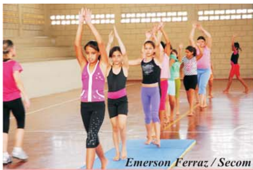
Emerson Ferraz / Secom