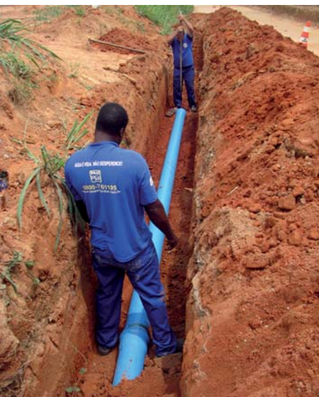
Carlos Lara / Saae AI

São tubos de seis polegadas de diâmetro, em PVC, que deverão ser assentados até o final da próxima semana, contribuindo para a melhoria do abastecimento daquela região.