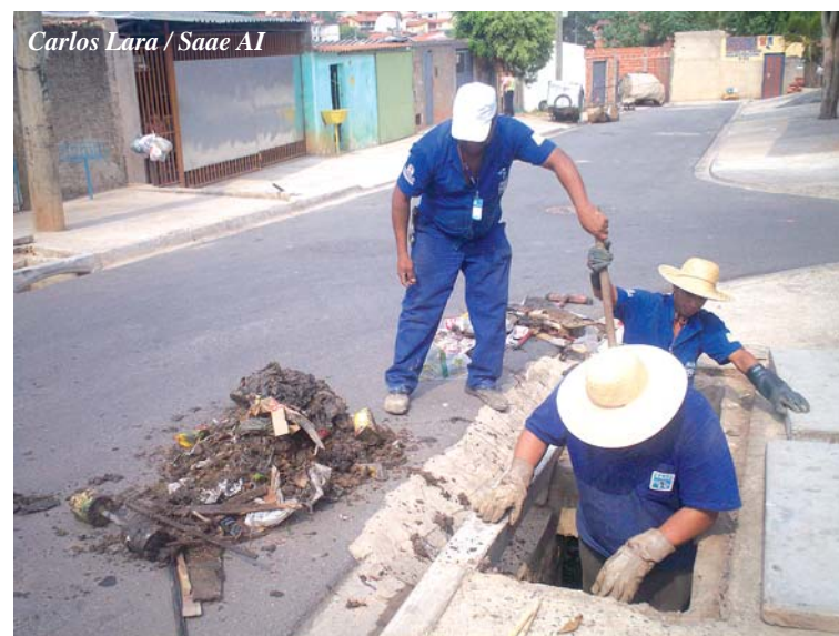
Carlos Lara / Saae AI

A autarquia fechou os doze meses do ano passado contabilizando 9.243 limpezas de bocas-de-lobo realizadas, retirando diariamente 12 toneladas de todo tipo de