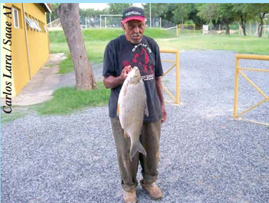
Carlos Lara / Saae AI

Os biólogos do Saae têm constatado que ao longo dos últimos anos, desde que a Estação de Tratamento de Esgoto Sorocaba 1 entrou em operação, em maio de 2005, a concentração de oxigênio do rio Sorocaba aumentou quase cinco vezes, fato que tem possibilitado o repovoamento com peixes de diversas espécies, e principalmente os curimatás.