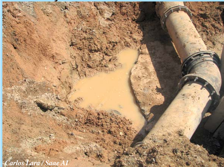
Carlos Lara / Saae AI

Saae coloca rede em carga novamente e abastecimento começa a ser normalizado