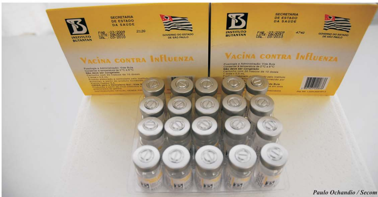
Paulo Ochandio / Secom