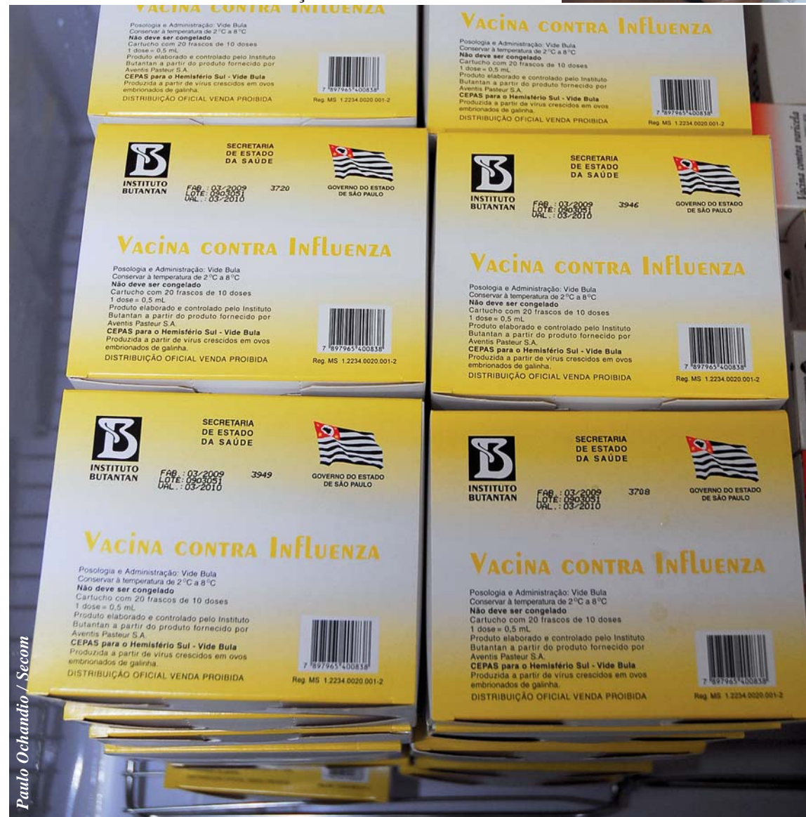
Paulo Ochandío / Secom