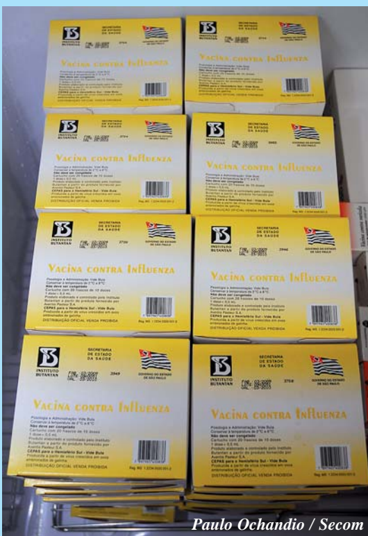
Paulo Ochandio / Secom

Em Sorocaba, até esta quarta-feira (13) 40.057 doses foram aplicadas, número que corresponde a 67,43% da população alvo da campanha na cidade. Para atingir a meta de 80% de cobertura, 7.500 idosos ainda precisam ser imunizados. A estimativa é que Sorocaba tenha 59.405 moradores com mais de 60 anos e o objetivo da campanha é atingir, pelo menos, 47.524.