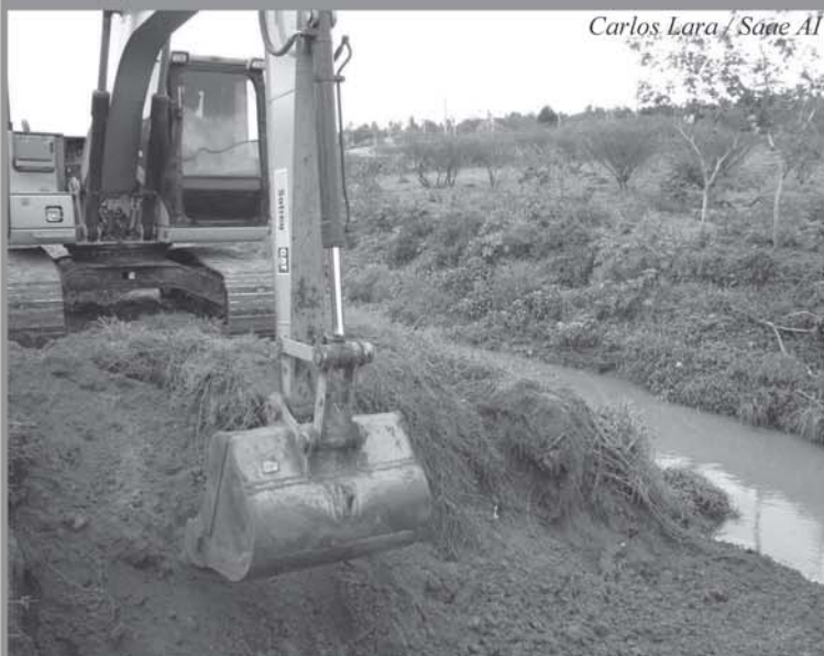
Carlos Lara / Saae Al

O Saae já iniciou as intervenções programadas para o córrego Itanguá - o mais extenso da cidade, com 42 km -, no trecho que atravessa o Jardim Marli, na região da Vila Helena. O objetivo é minimizar as ocorrências de alagamentos em períodos de fortes chuvas e dotar aquela região da cidade de infraestrutura urbanística e de lazer.