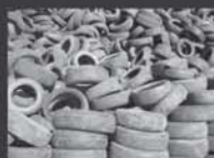
Pneus sem uso