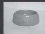
Vasilhas de água para animais