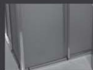
Trilhos de box de banheiro