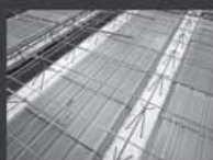
Lajes e Calhas