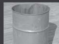
Tambor, barril e latão