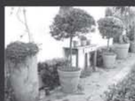
Pratos de Vasos de Plantas