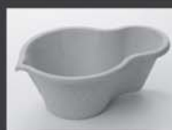
Objetos sem Uso

Qualquer ponto com água parada é um risco