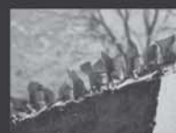
Cacos de Vidro nos Muros