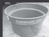
Caixas d' água