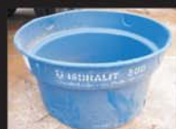
Caixas d' água