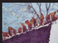
Cacos de Vidro nos Muros