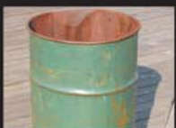
Tambor, barril e latão