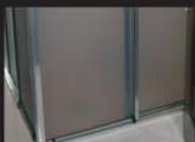
Trilhos de box de banheiro