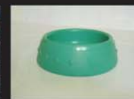
Vasilhas de água para animais