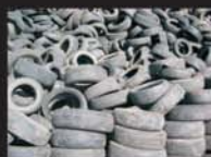
Pneus sem uso