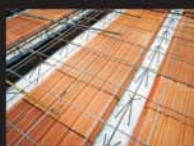
Lajes e Calhas