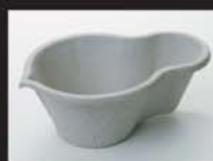
Objetos sem Uso

Qualquer ponto com água parada é um risco