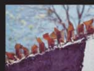
Cacos de Vidro nos Muros