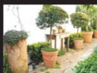
Pratos de Vasos de Plantas