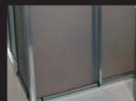
Trilhos de box de banheiro