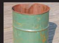
Tambor, barril e latão