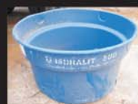
Caixas d' água