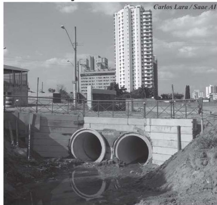
Carlos Lara / Saae AI

Numa primeira etapa, o Saae retirou a tubulação antiga e em seguida fez a escavação e a instalação dos novos tubos, que agora são de concreto, mais resistentes à ação