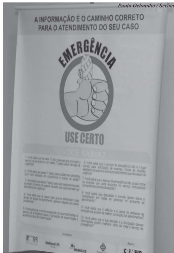
Paulo Ochandí / Secom

A decisão pela criação da campanha se deu em razão justamente do número elevado de atendimentos médicos em prontos-socorros e unidades pré-hospitalares de Sorocaba. Os membros da Comissão para Orientação ao Uso do Serviço de Emergência têm se reunido semanalmente,