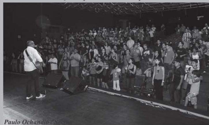
Paulo Ochandio / Secult

Das 12 músicas escolhidas para a final, que ocorrerá no dia 29 de novembro, os vencedores receberão os seguintes prêmios: 1º lugar: R$ 5 mil; 2º: R$ 3 mil; 3º: R$ 2 mil. Os melhores das categorias 'Arranjo', 'Intérprete' e 'Aclamação Popular' receberão R$ 1 mil cada. Além da premiação em dinheiro, os primeiros colocados também serão contemplados com troféus.