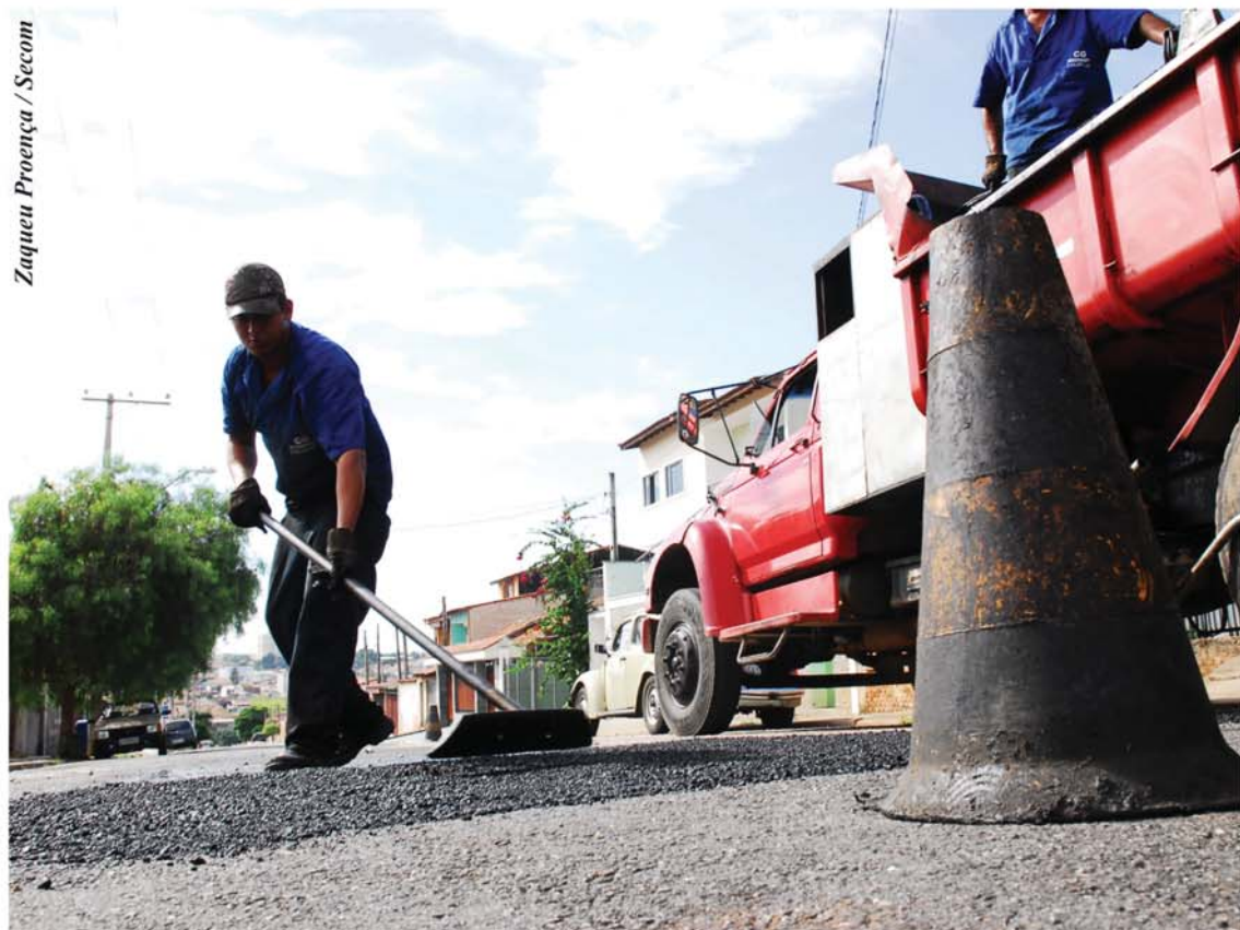
Zaqueu Proença / Secom

Os serviços de tapaburaco atenderam, na primeira semana de janeiro, a 41 ruas e avenidas, localizadas em 21 bairros da cidade. De acordo com levantamento da Secretaria de Obras e Infraestrutura Urbana (Seobe), a soma das ações representa aproximadamente 3,9 mil m 2 de massa asfáltica. Em razão do maior volume de chuvas registrado durante o verão, a Prefeitura de Sorocaba ampliou de três para cinco o número de equipes responsáveis pelos trabalhos.