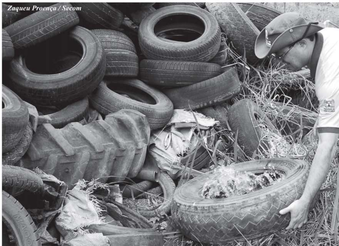
Zaqueu Proença / Secom

Centenas de pneus velhos foram removidas pela Prefeitura de Sorocaba nesta quarta-feira (30), resultando na eliminação de um grande foco de propagação do mosquito da dengue na Zona Norte de Sorocaba. A operação foi desenvolvida por agentes de serviço da Zoonoses e fiscais municipais numa área da Vila Helena, próximo ao aeroporto.