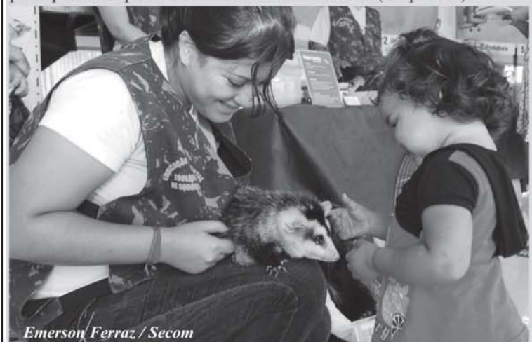
Emerson Ferraz / Secom

A exposição do Zoo acontecerá sempre às segundas-feiras, conforme agendamento. A atividade também vai acontecer às sextas-feiras com a equipe do Parque da Biquinha, com o trabalho "Biquinha vai à Comunidade". As escolas, ONG's e espaços comunitários interessados em receber as equipes devem fazer o agendamento com o setor educativo dos parques: 3227.5454 (Zoo) e 3224.1997 (Biquinha).