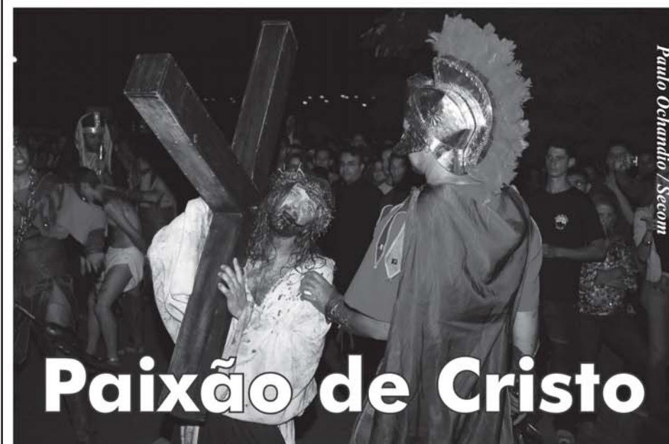
Paulo Ochandio / Secom