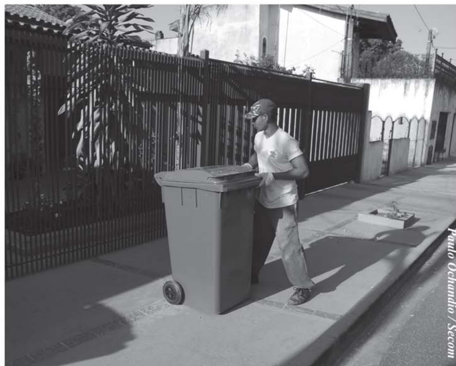
Paulo Ochandio / Secom

Devido à grande incidência de focos de dengue, os bairros a receber a troca, reposição e reparo de contêineres serão Vila Helena e adjacências, Vitória Régia I, II e III, Jardim Atílio Silvano, Vila Formosa, Jardim Maria do Carmo, Vila Gabriel, Barcelona, Colorau, Parque das Laranjeiras, Jd. Santo André, Jd. São Conrado, Jd. Guaíba, Vila Nova Sorocaba e Jd. Los Angeles. Já os bairros que possuem muitos recipientes danificados são: Trujillo, Vila Carvalho, Central Parque, Jd. Prestes de Barros, Vila Hortêncica, Jd. São Guilherme, Santa Rosália, Jd. Piratininga, Vila Haro, Jd. São Paulo, Jd. Guadalajara, Jd. Europa, Vila Angélica e Vila Santana.