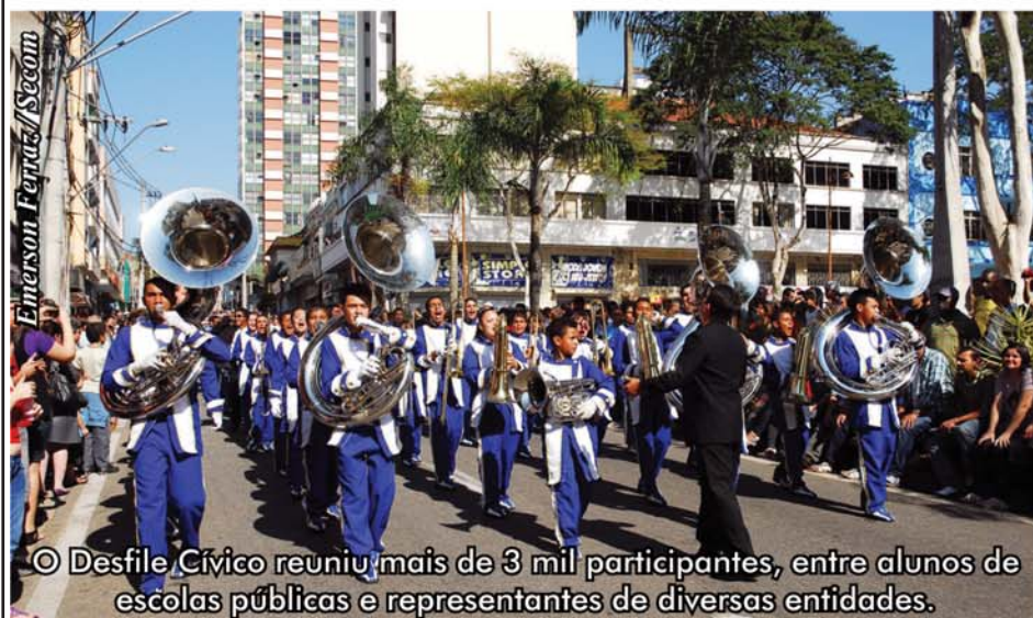
○ Desfile Cívico reuniu mais de 3 mil participantes, entre alunos de escolas públicas e representantes de diversas entidades.