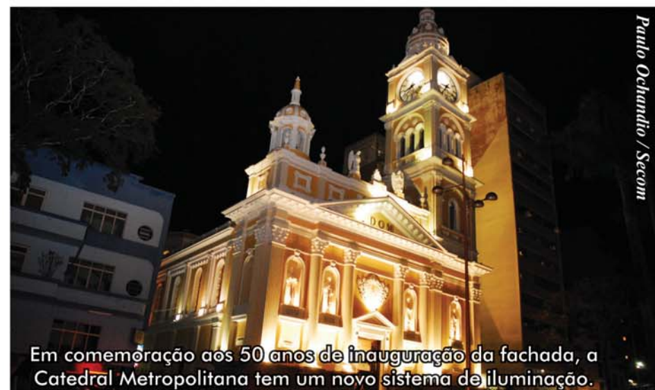
Em comemoração aos 50 anos de inauguração da fachada, a Catedral Metropolitana tem um novo sistema de iluminação.