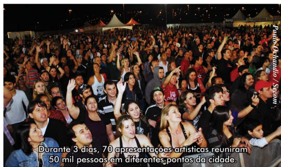
Durante 3 dias, 70 apresentações artísticas reuniram 50 mil pessoas em diferentes pontos da cidade.