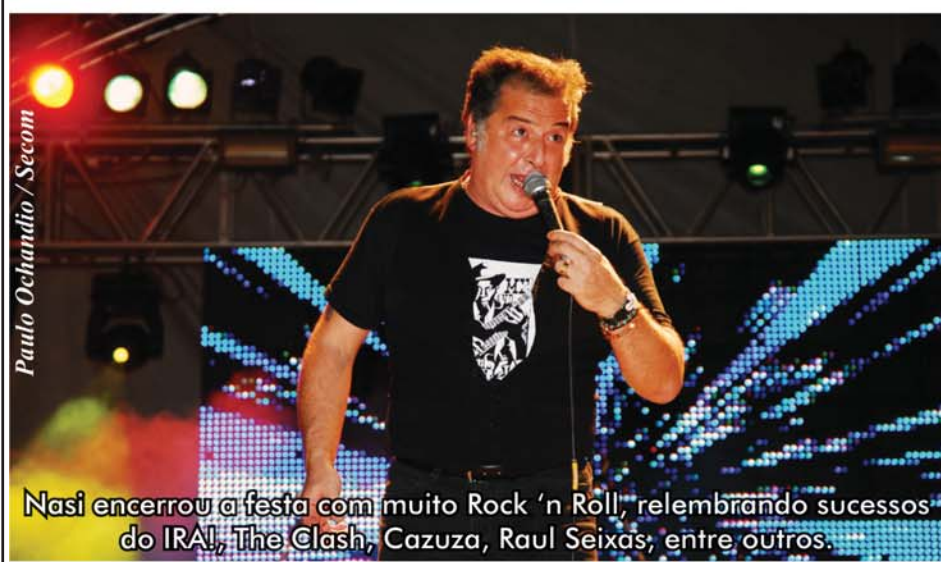
Nasi encerrou a festa com muito Rock 'n Roll', lembrando sucessos do IRA!, The Clash, Cazusa, Raul Seixas, entre outros.