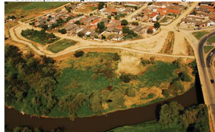
O dique de contenção do Vitória Régia preveniu muitos alagamentos.