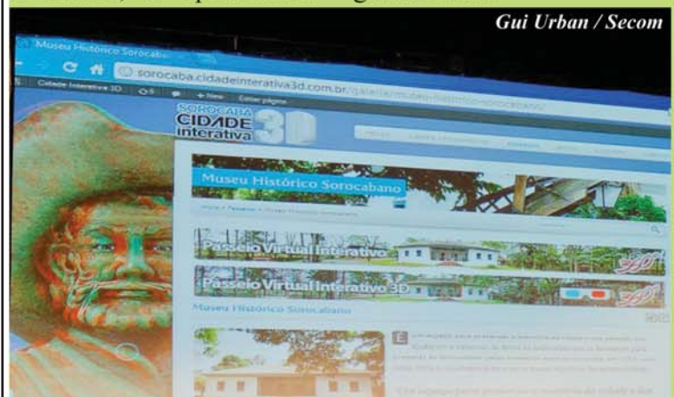
Gui Urban / Secom

O internauta poderá aproximar as imagens várias vezes e vê-las com detalhes, deslizando o mouse e obtendo as informações; até as curiosidades sobre uma pintura ou uma escultura, por exemplo. A visualização do conteúdo 3D estereoscópico é feita com o uso dos óculos anáglifos (lentes azul e vermelha), que fornecem a sensação de profundidade. O aparato custa em torno de R$ 2 e pode ser achado em bancas de jornais, mas quem não dispuser desse tipo de óculos poderá ver as imagens em 2D.