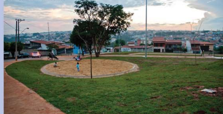
Gui Urban / Secom

A cerimônia foi encerrada com o plantio simbólico de três mudas de ipê amarelo, por crianças presentes no local.