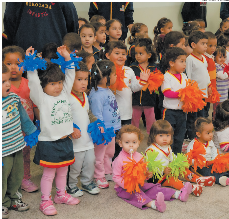
Gui Urban / Secom

A Prefeitura de Sorocaba anunciou nesta semana uma série de investimentos nas creches municipais, visando atender a grande demanda por vagas. Sob a ótica de que creche é um espaço educativo e um direito das crianças de 0 a 3 anos, 16 novas creches deverão ser inauguradas até o final de 2013, além da criação de um Centro de Inscrição, previsto para outubro deste ano, para que seja possível saber o número exato de crianças que aguardam por uma vaga. Hoje, as famílias cadastram a mesma criança em várias creches, o que