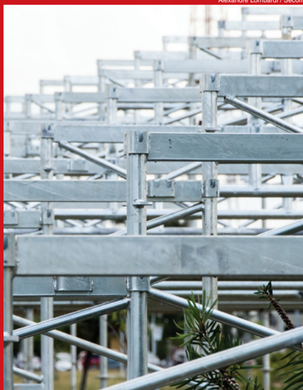
Alexandre Lombardi / Secom

A Prefeitura de Sorocaba promove nos próximos dias 1 e 2 de março (sábado e domingo), a partir das 20h, os desfiles das escolas de samba da Liga Sorocabana de Blocos e Escolas de Samba de Sorocaba (Lisobes) na Avenida Eng.º Carlos Reinaldo Mendes, em frente ao Paço Municipal. A empresa vencedora do processo licitatório já executa a montagem das arquibancadas.