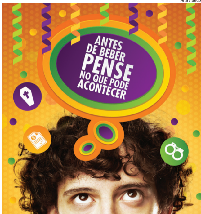
Arte / Secom

A cidade começou a ganhar nesta semana as cores do Carnaval. É mais uma campanha educativa desenvolvida pela Urbes – Trânsito e Transportes que já está nas ruas.