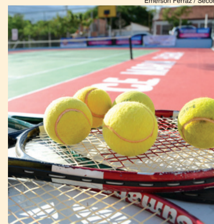
Emerson Ferraz / Secom

O espaço conta com medidas adaptadas e está aberto ao público desde outubro do ano passado, com disponibilidade de material esportivo. As aulas de iniciação ao esporte são aplicadas às quartas e sextas-feiras: às 8h30 para crianças de 7 a 12 anos; e, a partir das 9h30, o ensino é destinado para adolescentes a partir de 13 anos.