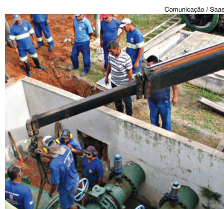
Comunicação / Saae

O Serviço Autônomo de Água e Esgoto (Saae) dá prosseguimento neste domingo (9) à série de intervenções na Estação de Tratamento de Água (ETA) do Cerrado, que têm como objetivo a ampliação em 49% da sua capacidade de bombeamento e conseqüentemente a melhoria do sistema de distribuição da cidade como um todo.