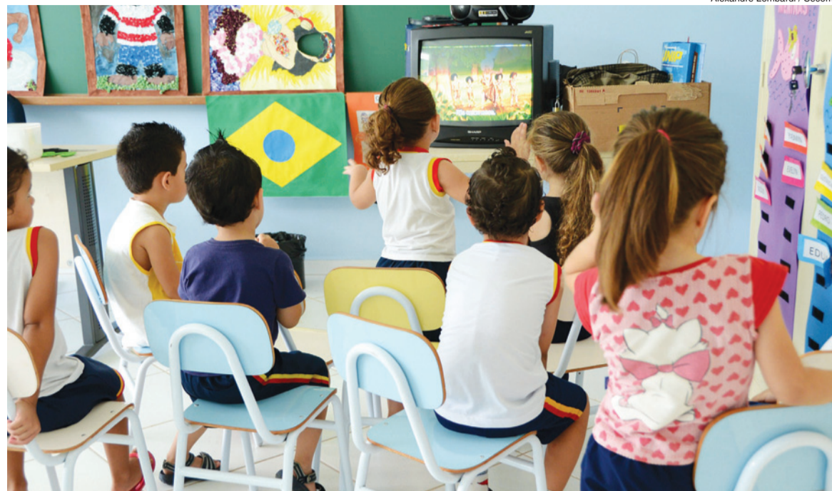
Alexandre Lombardi / Secom

A Prefeitura de Sorocaba já definiu às oito áreas que vão receber a construção de novas creches por meio de um convênio com o Governo do Estado de São Paulo. Pelo programa Creche-Escola, o Estado fica responsável por repassar os valores financeiros e acompanhar o andamento das construções.