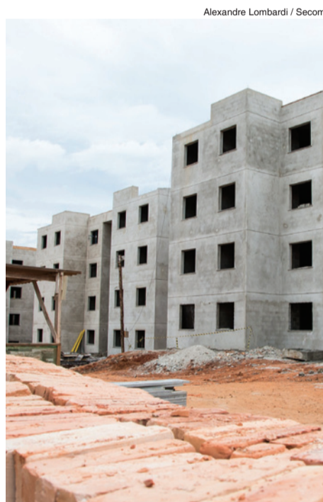
Alexandre Lombardi / Secom

Em 2013, a Prefeitura de Sorocaba assinou contratos e estão em andamento obras para a construção de 6.540 moradias. Entre elas: Residencial Jardim Carandá e Altos de Ipanema na região do Parque São Bento, além do Residencial "Bem Viver", no Cajuru (foto), "Viver Melhor", no Jardim Betânia, Nikkey, na Aparecidinha e um Residencial no bairro do Horto.