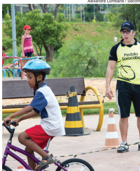
Alexandre Lombardi / Secom

Crianças, jovens e adultos interessados em aprender a andar de bicicleta, ou ainda, que queiram aprimorar suas técnicas de pedalar, podem participar da “Escola do Pedala” que acontece todos os domingos, das 9h às 12h, no Parque das Águas. A atividade é realizada pela Prefeitura de Sorocaba, por meio da Urbes – Trânsito e Transportes, a fim de ensinar qualquer pessoa a andar de bicicleta com segurança.