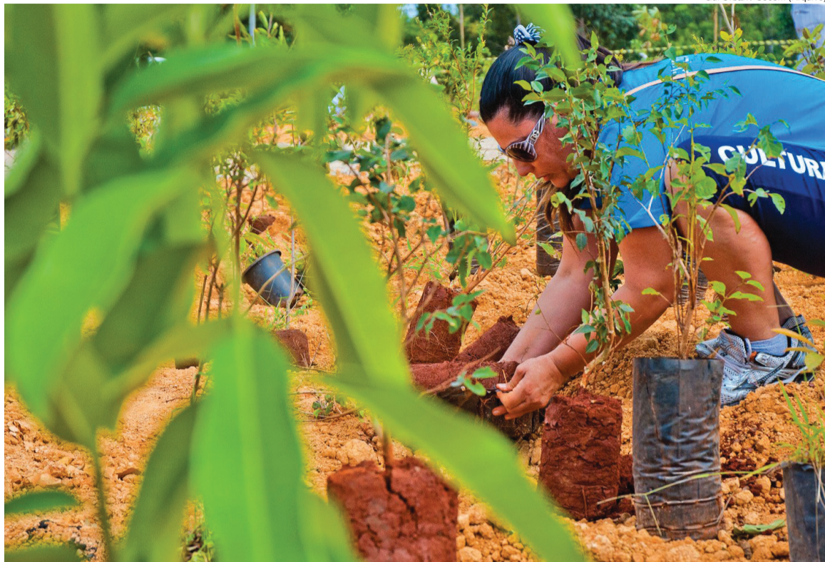
Gui Urban / Secom (Arquivo)

A Prefeitura de Sorocaba apresentou nesta semana o resultado do Inventário de Emissões de Gases de Efeito Estufa da cidade. O estudo analisou as fontes de emissão de dióxido de carbono (CO2), óxido nitroso (N2O) e metano (CH4) nas atividades produtivas do Município e a quantidade de gases que foi lançada na atmosfera entre 2002 e 2012. O sorocabano emite 1,57 toneladas de CO2 equivalentes por ano. Outro dado apresentado é que o setor de energia é responsável pela emissão de 75,67% dos gases de efeito estufa (GEE).