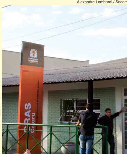
Alexandre Lombardi / Secom

Integrante do Sistema Único de Assistência Social (Suas), a unidade do Cajuru está localizada na Rua Jorge Elias, 42, e funciona de segunda a sexta-feira, das 8h às 17h.