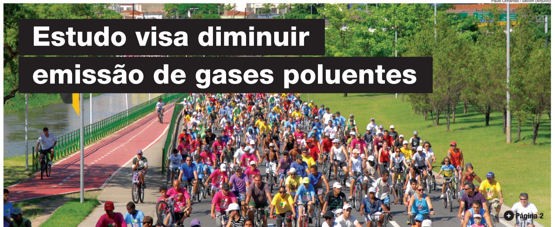
Paulo Ochandio / Secom (Arquivo)