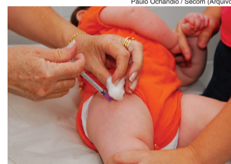
Paulo Ochandio / Secom (Arquivo)