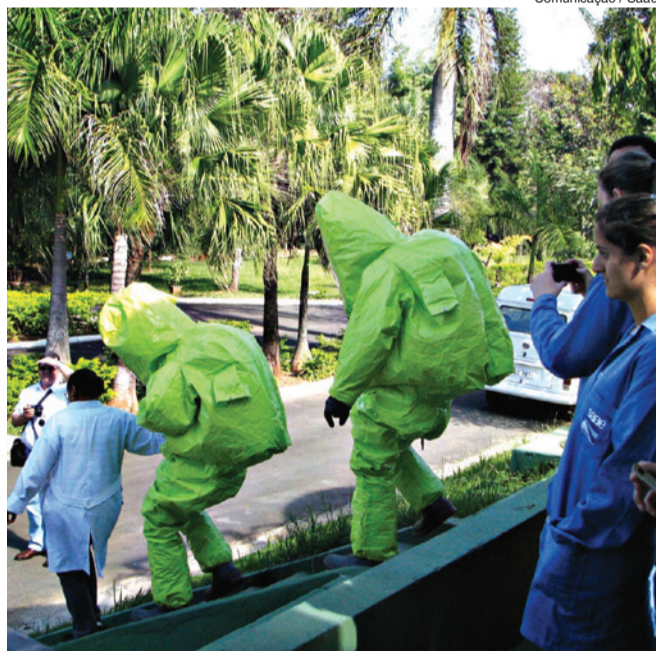
Comunicação / Saae

Diariamente, o Serviço Autônomo de Água e Esgoto (Saae) utiliza cerca de mil quilos de cloro no processo de tratamento de água nas Estações de Tratamento de Água (ETA) do Cerrado e do Éden, que juntas têm uma capacidade de processamento de 2.500 litros de água por segundo.