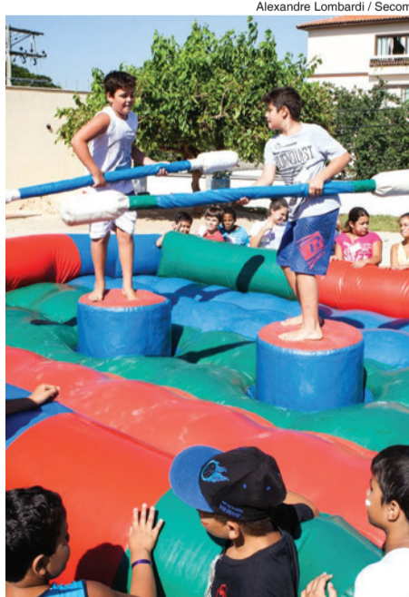
Alexandre Lombardi / Secom

A inscrição deve ser feita pessoalmente de segunda a sexta-feira, na Secretaria de Desenvolvimento Social (Rua Santa Cruz, 116, Centro). Mais informações pelo telefone 3219.1920.