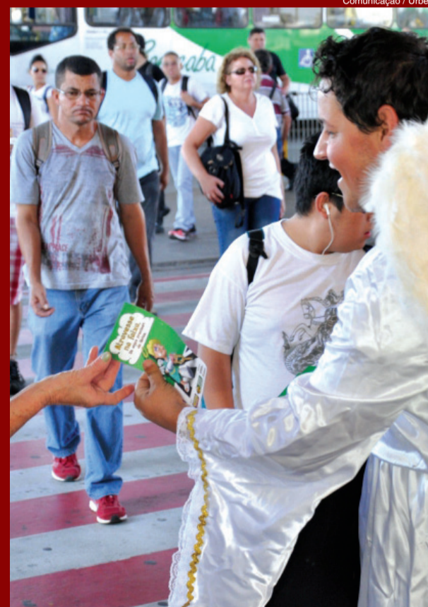
Comunicação / Urbes

Na programação da Semana Nacional do Trânsito de Sorocaba, os arte-educadores da Urbes – Trânsito e Transportes podem ser vistos vestidos de anjos em ruas, avenidas, Terminais de Ônibus e demais espaços públicos da cidade. A blitz educativa, cujo mote é “Atravesse na faixa, os anjos precisam de férias” tem por objetivo de chamar a atenção da população para a importância do respeito à faixa de pedestres.