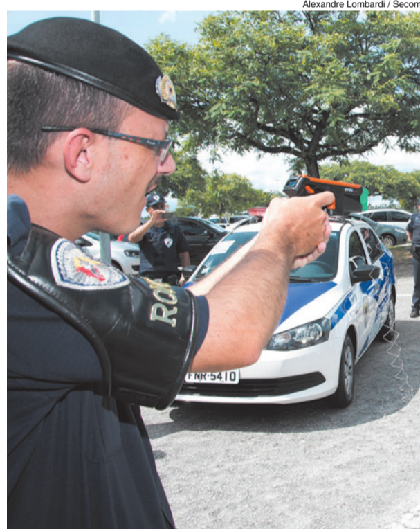
Alexandre Lombardi / Secom

A Guarda Civil Municipal (GCM) recebeu equipamentos provenientes do programa "Crack, é Possível Vencer". Foram dois ônibus equipados com câmeras de videomonitoramento, quatro viaturas tipo Voyage, quatro motocicletas, 100 armas de condutividade elétrica, além de sprays de pimenta.