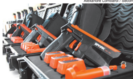
Alexandre Lombardi / Secom