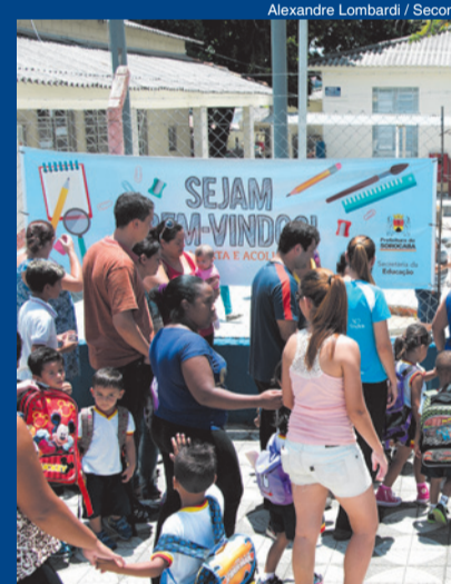
Alexandre Lombardi / Secom

Cerca de 50 mil alunos da rede municipal de ensino de Sorocaba voltaram às salas de aula na última segunda-feira (9). Para recebê-los, a Prefeitura de Sorocaba realizou o Projeto "Escola Aberta e Acolhedora", onde as crianças e até mesmo os pais foram recepcionados pelos funcionários das unidades.