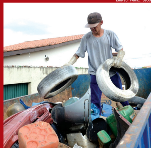
Emerson Ferraz / Secom

Os arrastões realizados entre todo o mês de fevereiro e o dia 6 de março retiraram, de 16 bairros visitados, 45.900 kg de materiais inservíveis que eram ou poderiam ser criadouros do mosquito transmissor da dengue, o Aedes aegypti . De acordo com a Secretaria da Saúde (SES), a maior parte dos criadouros – cerca de 90% – ainda continua dentro das casas.