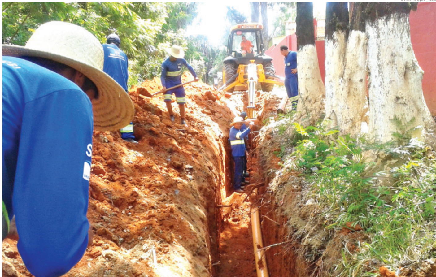
Comunicação / Saae

O serviço Autônomo de Água e Esgoto (Saae) está executando serviços de instalação de rede coletoras de esgoto nos bairros Brigadeiro Tobias, Recreio dos Sorocabanos (no final da avenida Ipanema) e Chácaras Reunidas São Jorge (no quilômetro 105 da rodovia Raposo Tavares). No total, são R$ 2.938.281,00 em financiamentos do Reágua, abrangendo ainda outras obras que se encontram em processo de licitação, que incluem rede coletora de esgoto para o bairro Bom Jesus, no final da avenida Ipanema, com extensão de 2.640 metros; coletor-tronco de esgoto no Bosque Ipanema, com 929 metros de extensão, para o recebimento do esgoto de 600 imóveis deste condomínio popular e também de 542 unidades residenciais do Jardim Botucatu, além de outras obras.